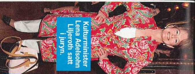
Kulturminister Lena Adelsohn Liljeroth satt i juryn.